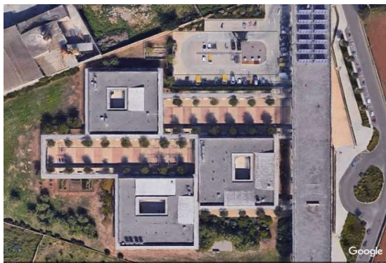
Residència Son Llebre