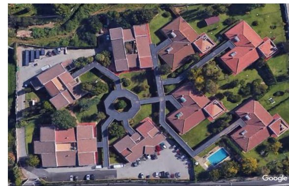
Residència Son Tugores